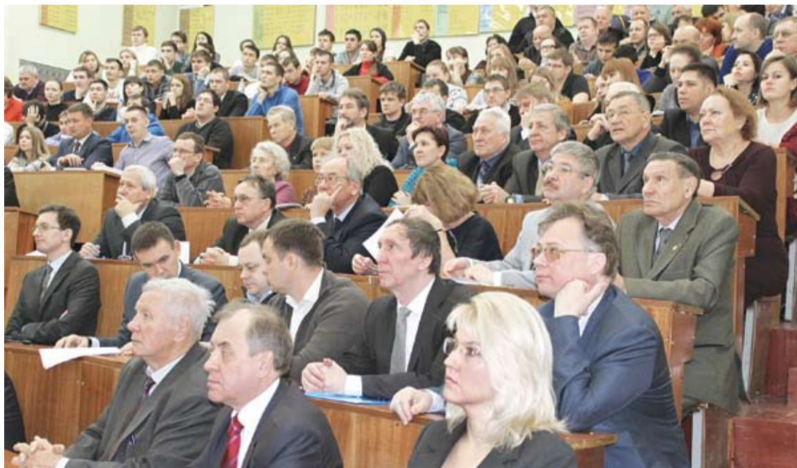
Материалы подготовила Алла Кайбиянен

Интересная информация о новейших российских и зарубежных разработках в области энергонасыщенных материалов, полученная на лекциях и семинарах школы, плодотворное общение с коллегами, промышленниками и генеральными конструкторами – все это позволит участникам повысить эффективность научных исследований и коммерциализации инновационных разработок, совершенствовать преподавание учебных дисциплин, еще глубже интегрироваться в российское и международное научно-образовательное пространство, укреплять связь с отраслевыми предприятиями.