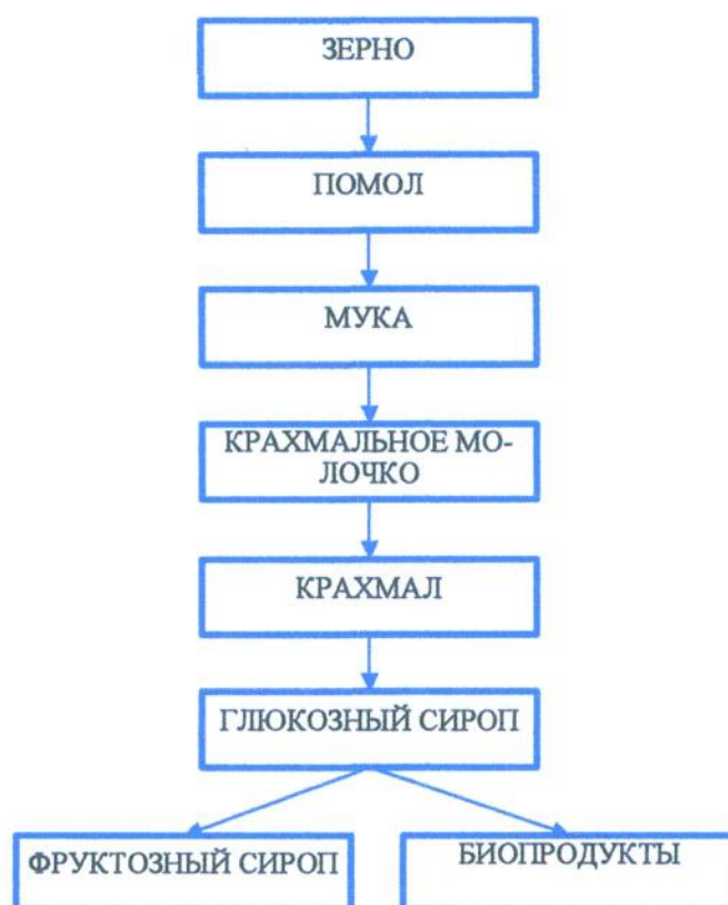
Схема глубокой переработки зерна

перекись водорода (в пересчете на 100 процентов): < 0,75 кг/кг ОП.