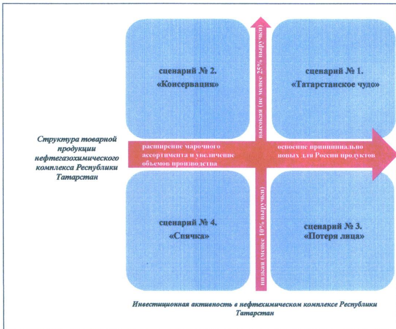
Рис.2. Матрица сценариев развития нефтегазохимического комплекса Республики Татарстан в перспективе до 2034 года.