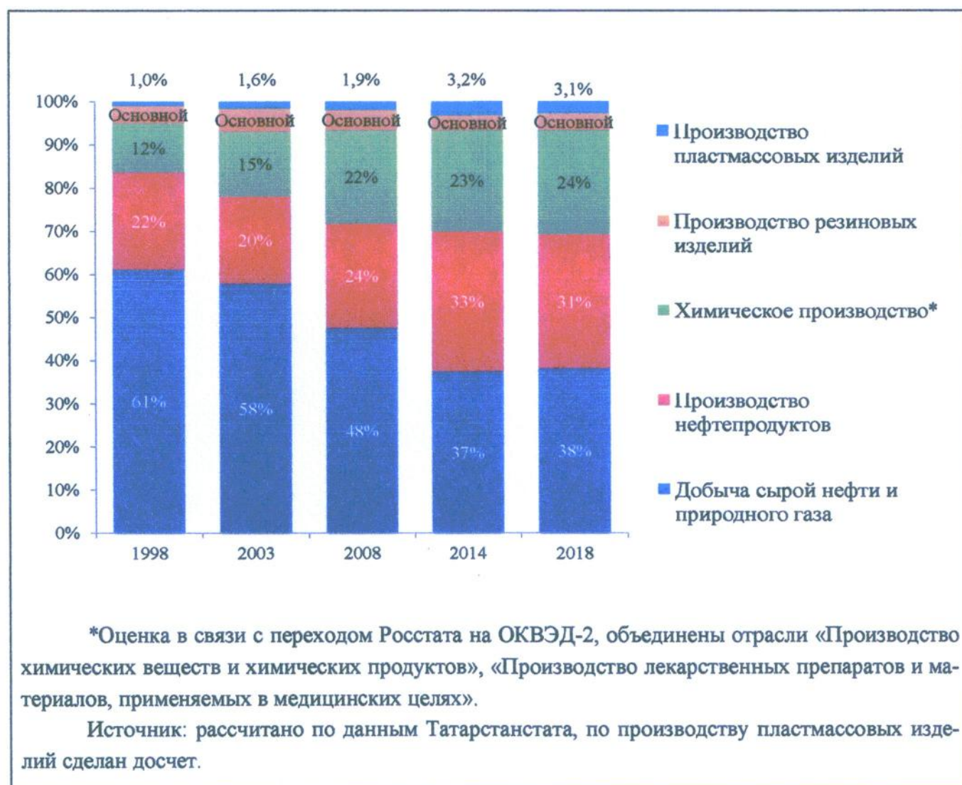
Рис.1. Структура нефтегазохимического комплекса Республики Татарстан в 1998 – 2018 годах (в ценах 2014 года).

Среднесписочная численность работников на предприятиях нефтегазохимического комплекса Республики Татарстан сохранилась на уровне 2014 года. Увеличение количества сотрудников наблюдается в производстве нефтепродуктов в связи с реализацией инвестиционных проектов. В производстве резиновых изделий численность работников снизилась вследствие оптимизации штата на предприятиях.