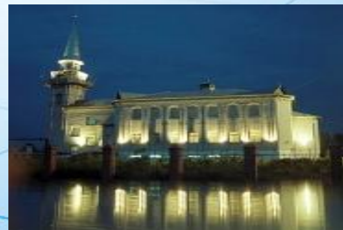
Мечеть Сахарного завода