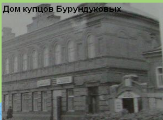
Дом купцов Бурундуковых

Со временем Буинск стал типичным уездным провинциальным городом с городничими и канцеляристами, питейными домами, еженедельными базарами с торговыми лавками и мелкими промышленными заведениями – кожевенными, кирпичными, суконными и пр. Застройка города в основном была деревянной, одноэтажной. Однако в конце XIX – начале XX вв. на главных улицах появилось довольно много представительных зданий из красного кирпича – в том числе здания земской управы, уездной аптеки, низшей ремесленной школы, дом купца Бурундуковского и т.д.