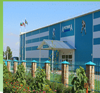
Ледовый дворец «Арктика»