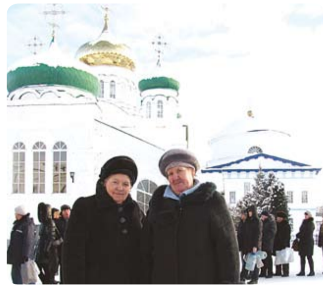
• Ветераны в Раифском Богородицком мужском монастыре 21.01.2014 г.