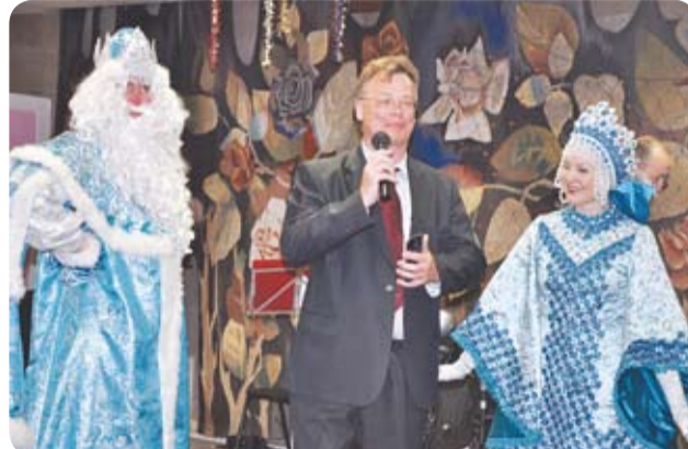
• Новогодние вечера» в КСП 13 и 14 января 2014 г.