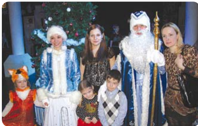
• «Новогодняя ёлка» в Молодёжном театре на Булаке 22 декабря 2013 г.

Новогодние праздники в университете были отмечены многочисленными мероприятиями для сотрудников и их детей, организованными администрацией и профсоюзным комитетом вуза.