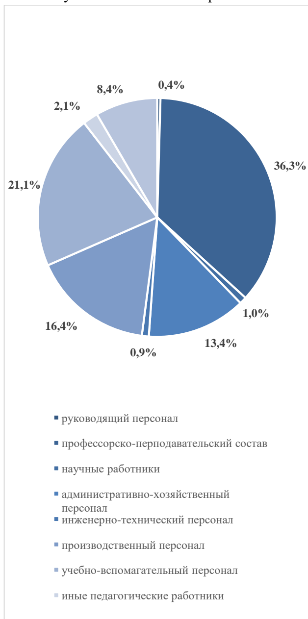
Рис. 2. Структура персонала

В КНИТУ работает 3196 чел. (без учета филиалов). Структура штатного персонала КНИТУ представлена на рис. 2, характеристика по признаку «наличие ученой степени» и «наличие ученого звания» – на рис. 3.