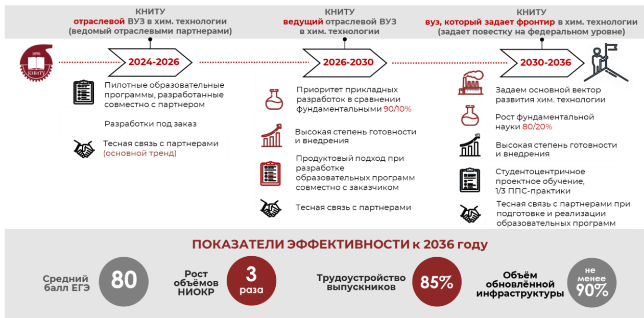
Рисунок 1 – Целевой образ КНИТУ

развития Республики Татарстан (рисунок 1).